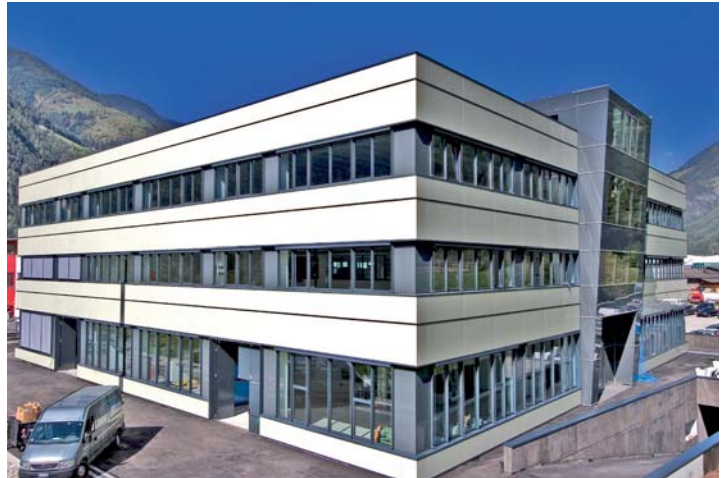
Siedziba Zirkonzahn w Gais