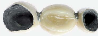
Widok od środka na 3 punktowy most

Podbudowa metalowa zawierająca ciemne krawędzie.